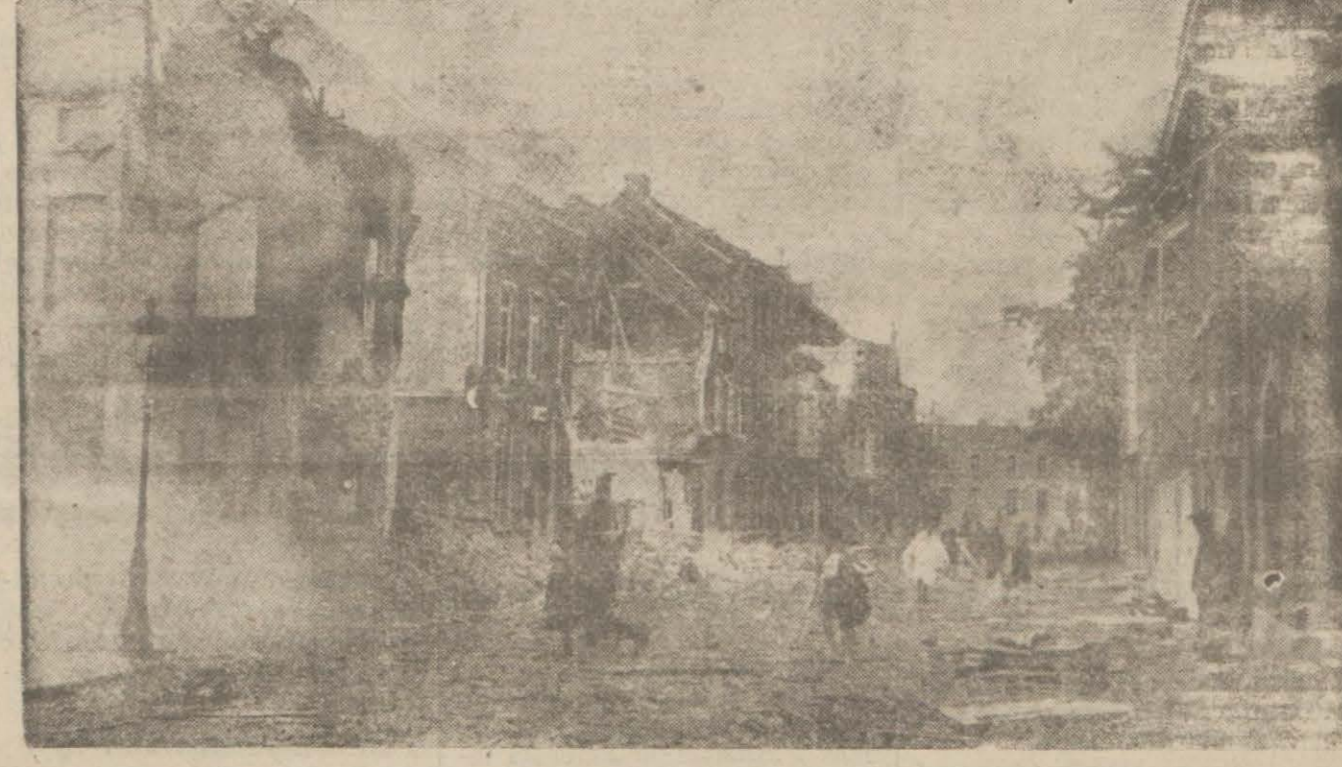
İŞİK ŞEHRİ PARİSİN ALMAN BOMBALARI İLE YANGIN YERİNE DÖNEN SOKAĞI

ALMAN BOMBALARI ALTINDA HARAB OLAN PARIS ŞEHRİNİN MÜDAFAASI HARBİ DÜN BAŞLADI