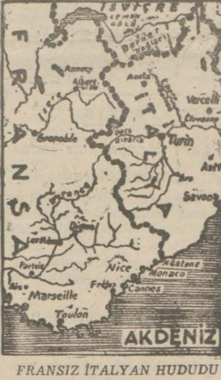
FRANSIZ İTALYAN HUDUDU

LONDRA, 12 (A.A.) — R. A. F mensup ağır bombardıman tayyarelerinin İngiltereden İtalyaya uçup yapıtarak Cenova ve Torinodaki askeri hedefleri bombardıman ettikleri resmen bildirilmektedir. LONDRA, 12 (A.A.) — İngiliz radyosu, büyük Britanya hava kuvvetlerinin Lybie'deki İtalyan üslerini muvaffakiyetle bombardıman ettiklerini bildiriyor. Aynı radyo, Baltık üzerinde bulunan Rostok şehrindeki Heinkel fabrikasının yeniden bombardıman edildiğini ve yangın çıktığını bildiriyor. İSKENDERİYEDE ALARM İSKENDERİYE, 12 (A.A.) — Burada saat 19.31 de 10 dakika süren bir alarm işareti verilmiştir. Protoria, 12 (A.A.) — Bugün Cenup Afrikasının ilk harp te-