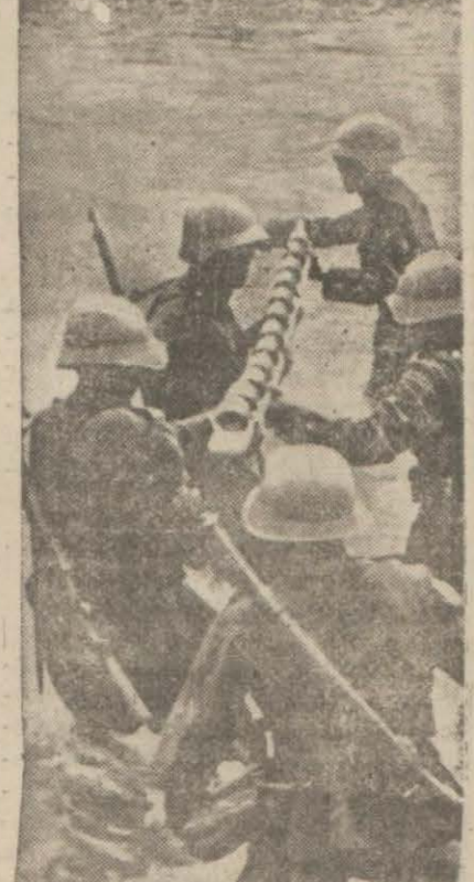
İsviçre askerlerinden bir grup

Romanya İtalyanın verdiği teminata kıymet vermiyor